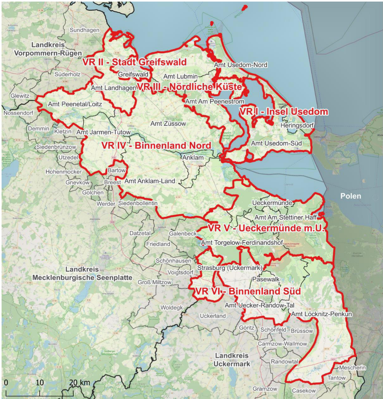
Übersichtskarte Landkreis Vorpommern-Greifswald