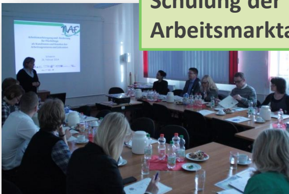
Schulung der Arbeitsmarktakteure