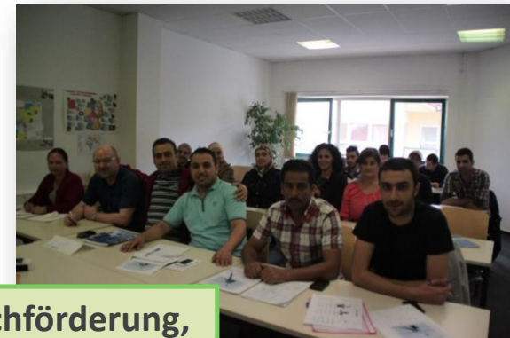
Verweisberatung: Sprachförderung, Anerkennung, Qualifizierung etc.