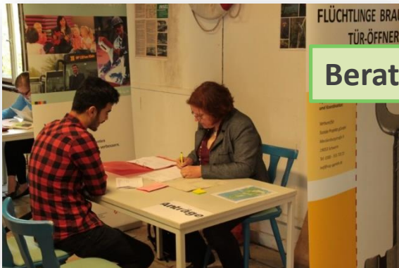
Beratung und Coaching