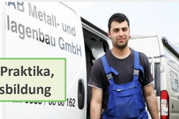
Vermittlung in Praktika, Arbeit oder Ausbildung